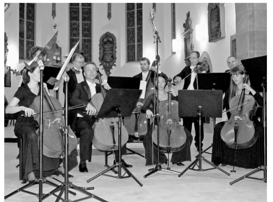
Vier Cellos, tragende Instrumente des Kammerorchesters Basel.

Mit Superlativen sollte man sparsam umgehen. Was jedoch Giuliano Carmignola auf Pietro Guarneris Violine von 1733 hinauberte, war einfach grosse Klasse. Im «kleinen Violinkonzert» konnte der charismatische Musiker aus Venedig zeigen, was perfekte Klangmagie ist. Er wirkte als Solist mit makelloser Intonation, vielen Farbnuancen und einem wahren Feuerwerk an mitreissenden Gestaltungseinfällen, die jeweils vom Orchester harmonisch aufgegriffen und gekontert wurden.