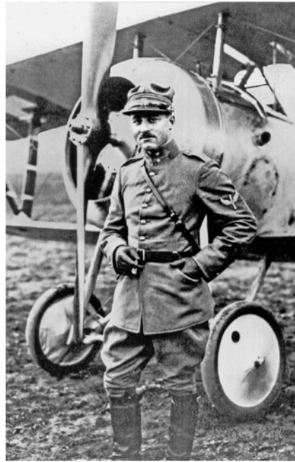
und Oskar Bider Bilder zvg

Am 7. Juli 1919 sollte der Langenbrucker nach Varese reisen, um das erste Flugzeug zu übernehmen und nach Zürich fliegen, wo die neue «Gesellschaft für Lufttourismus» ei-